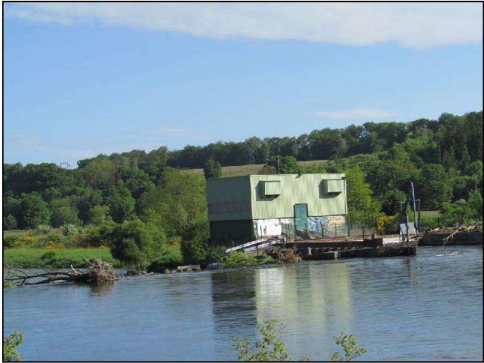
Centrale sur la Moselle