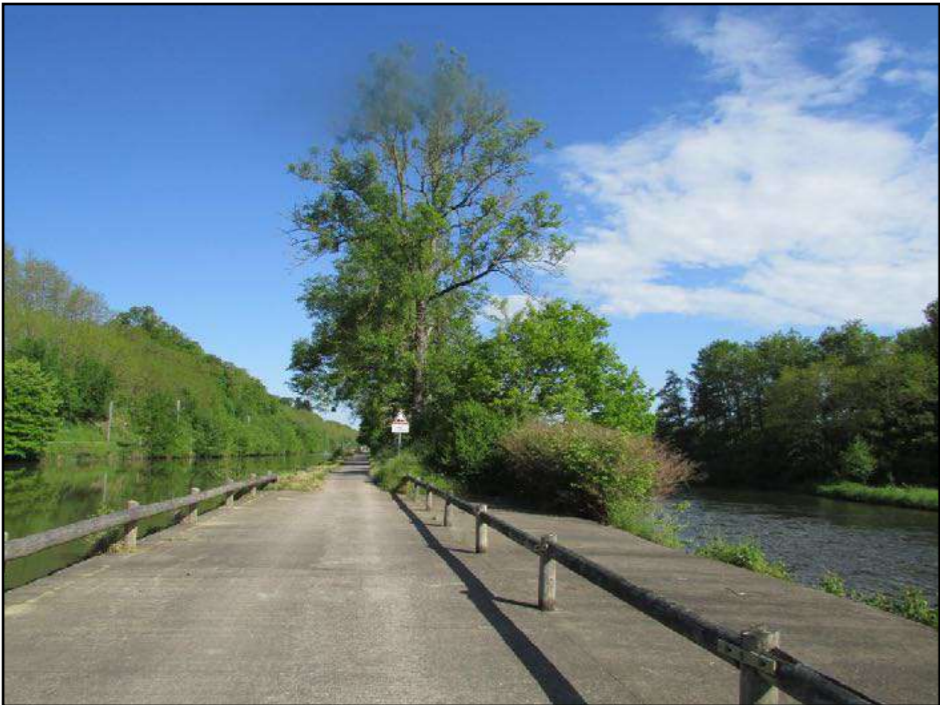
entre le canal des Vosges et la Moselle