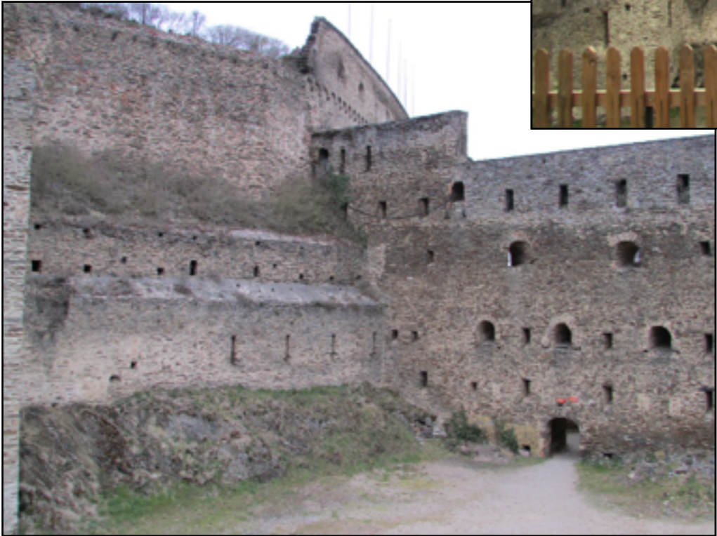
le Burg Rheinfels domine Sankt-Goar et le Rhin