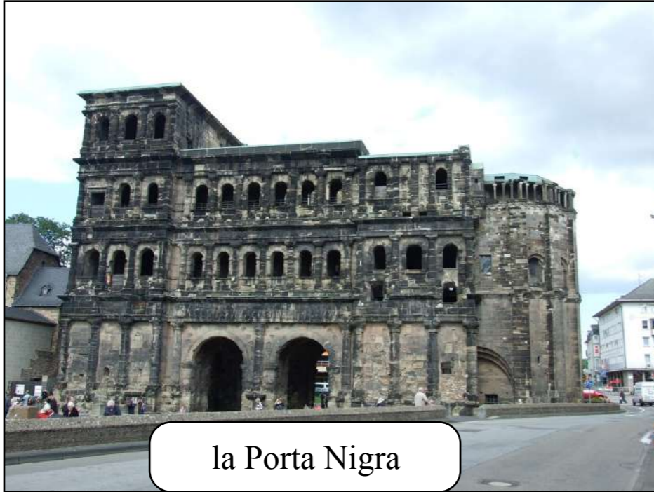
la Porta Nigra