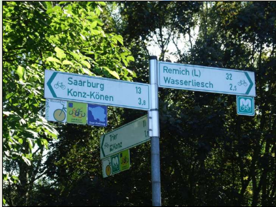
le confluent de la Sarre et de la Moselle