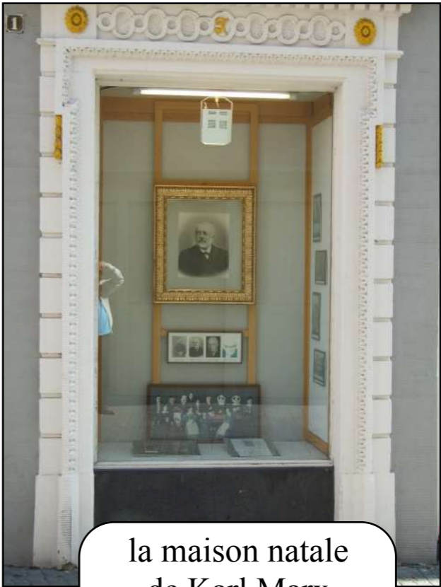
la maison natale de Karl Marx