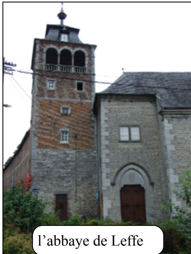
l'abbaye de Leffe