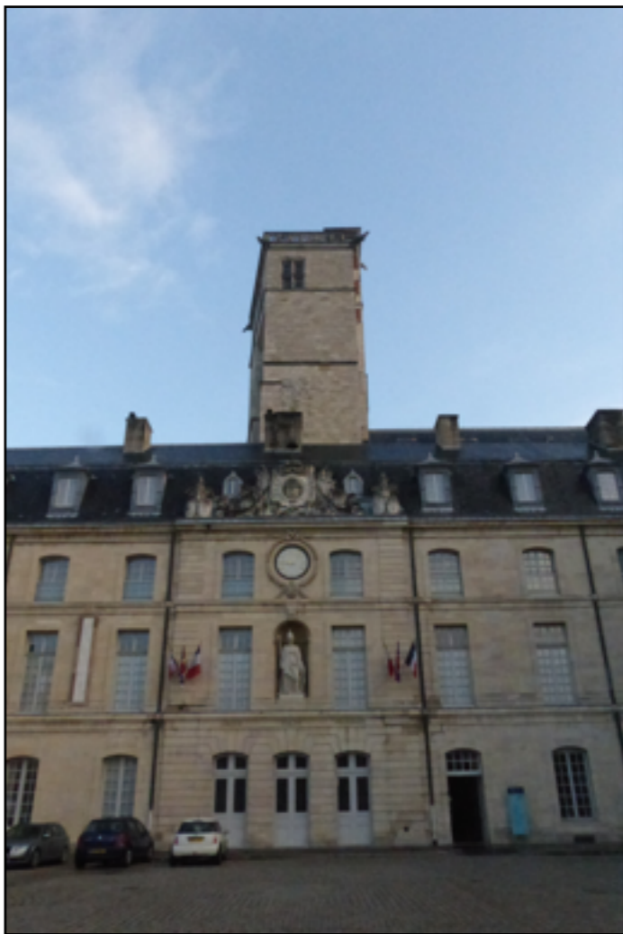
Place de la Libération (km1,6)

En savoir plus [Accès à un livret avec carte, photos et textes]