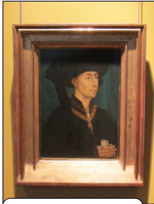
Philippe le Bon