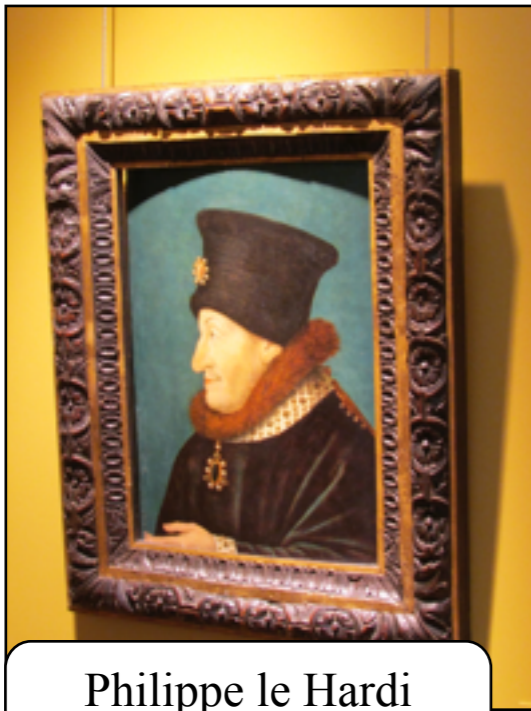
Philippe le Hardi