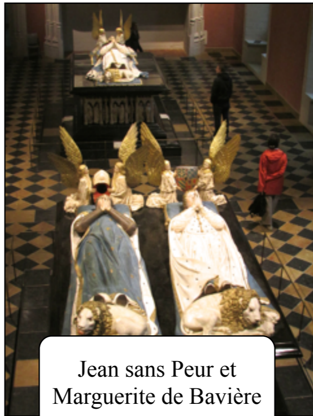
Jean sans Peur et Marguerite de Bavière