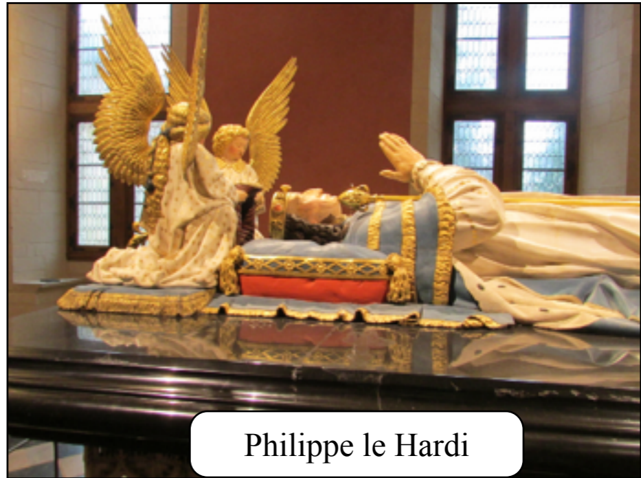
Philippe le Hardi