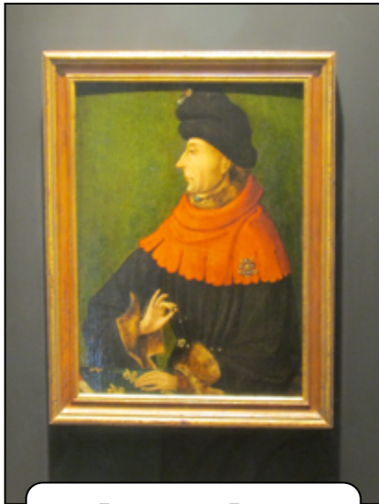
Jean sans Peur