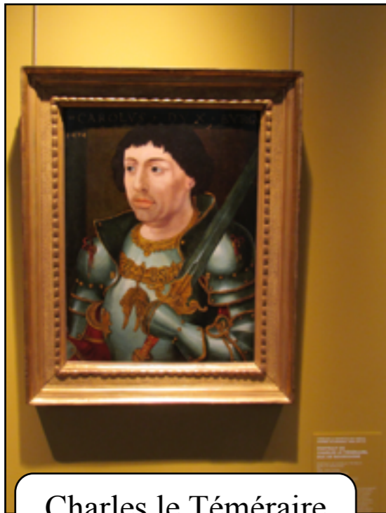
Charles le Téméraire