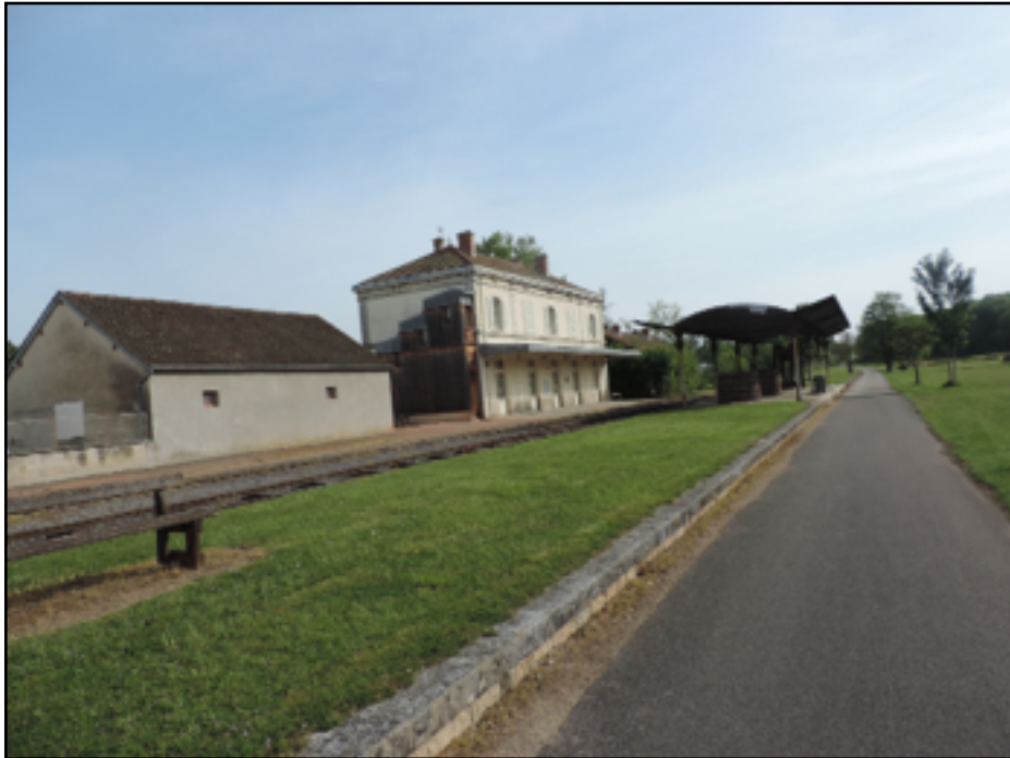
La Voie Verte occupe une ancienne voie ferrée