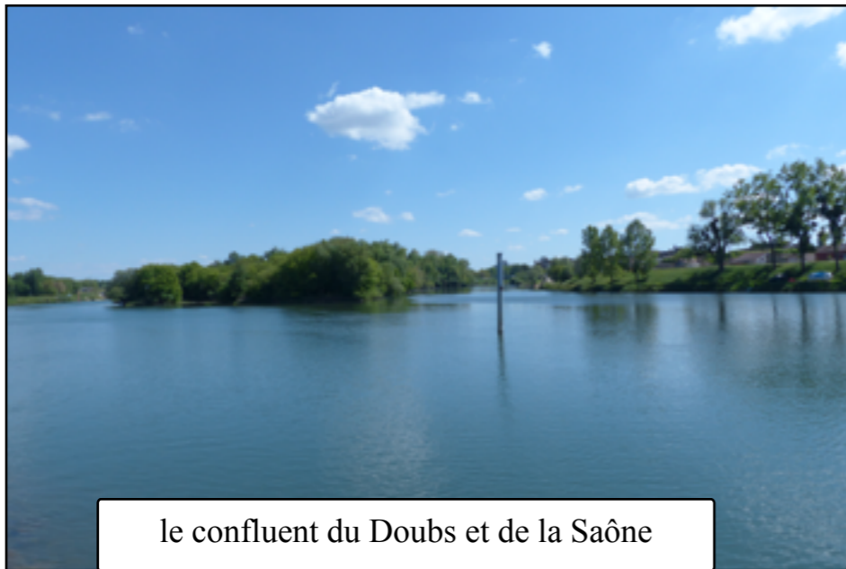
le confluent du Doubs et de la Saône