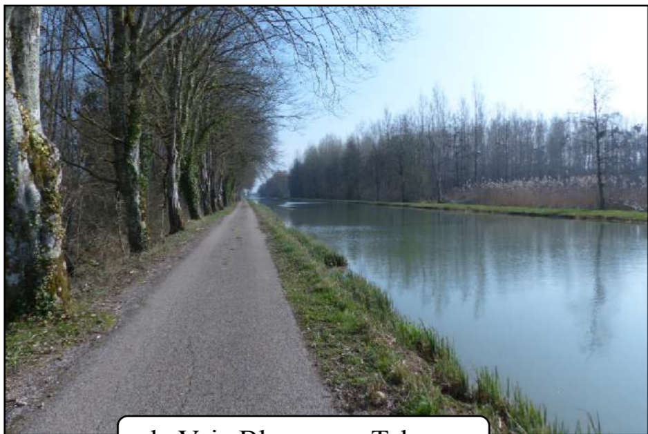
la Voie Bleue vers Talmay

En savoir plus (Accès à un livret avec carte, photos et textes)