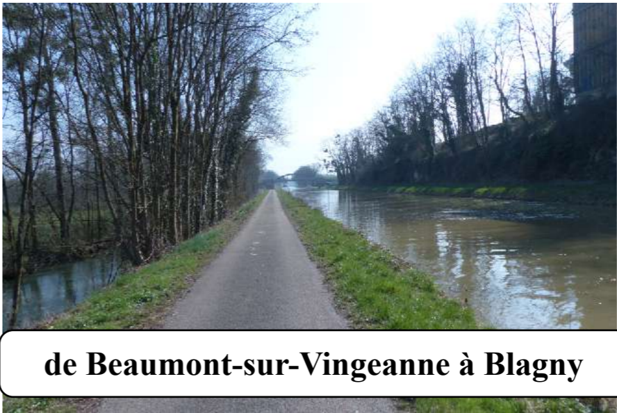
de Beaumont-sur-Vingeanne à Blagny