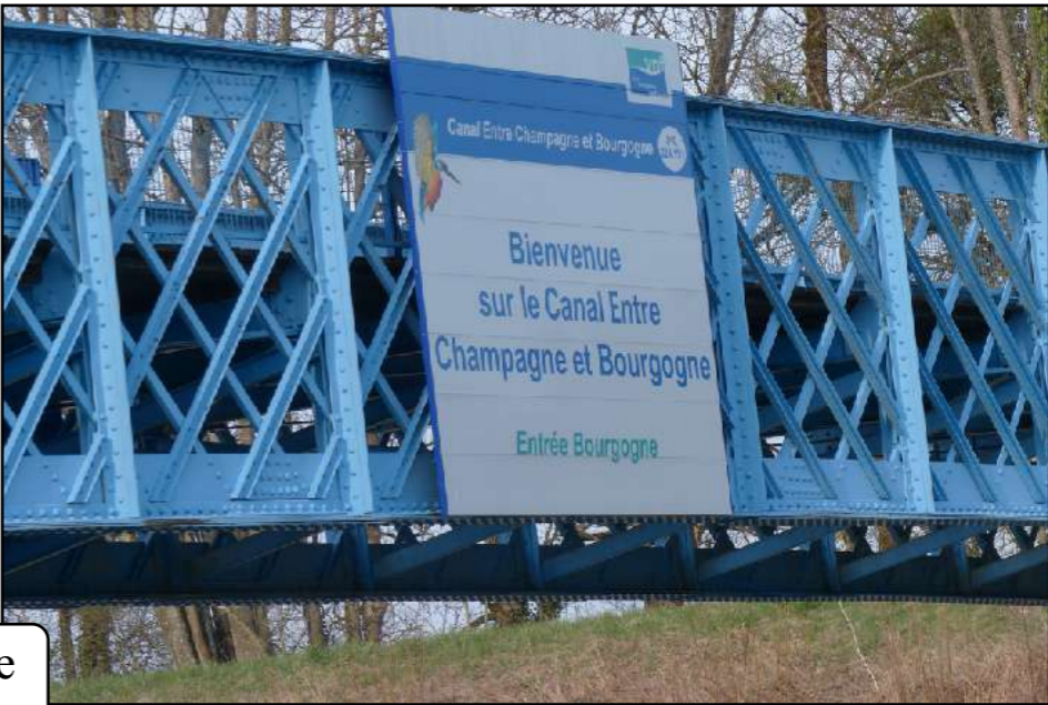
c'est ici que se termine le canal entre Champagne et Bourgogne, en rejoignant la Saône