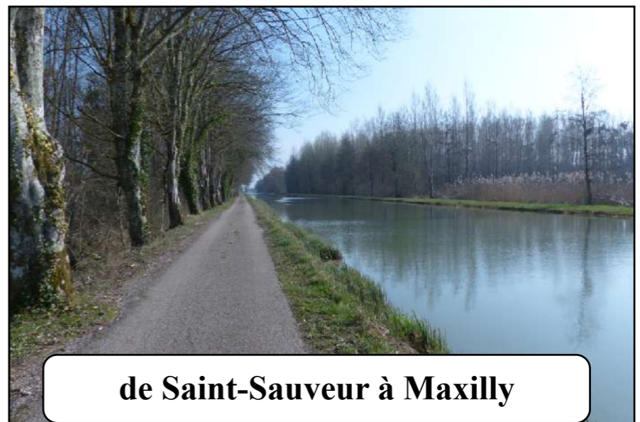
de Saint-Sauveur à Maxilly