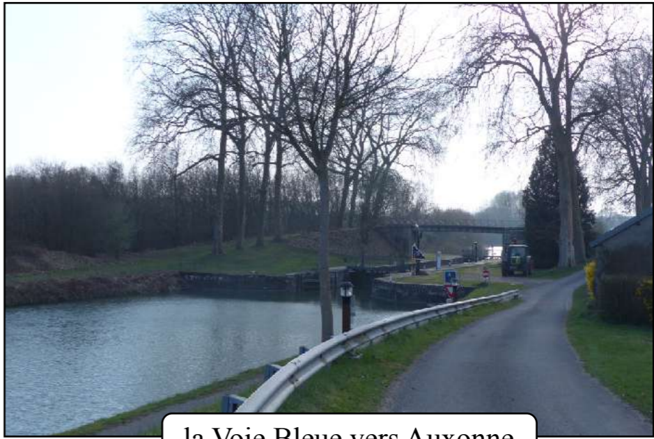
la Voie Bleue vers Auxonne