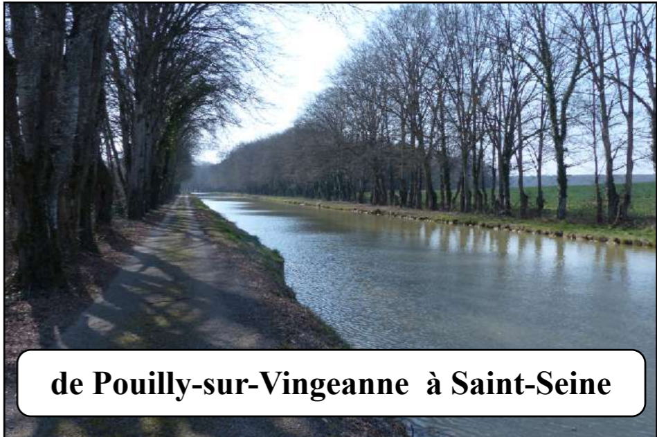
de Pouilly-sur-Vingeanne à Saint-Seine