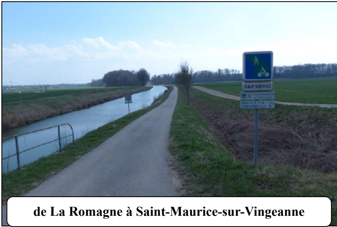
de La Romagne à Saint-Maurice-sur-Vingeanne