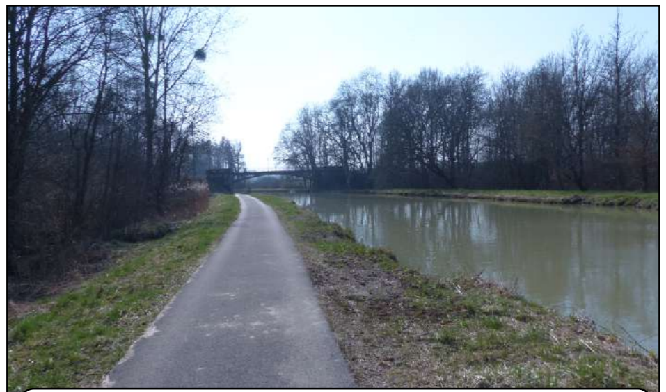
de Fontenelle à Licey