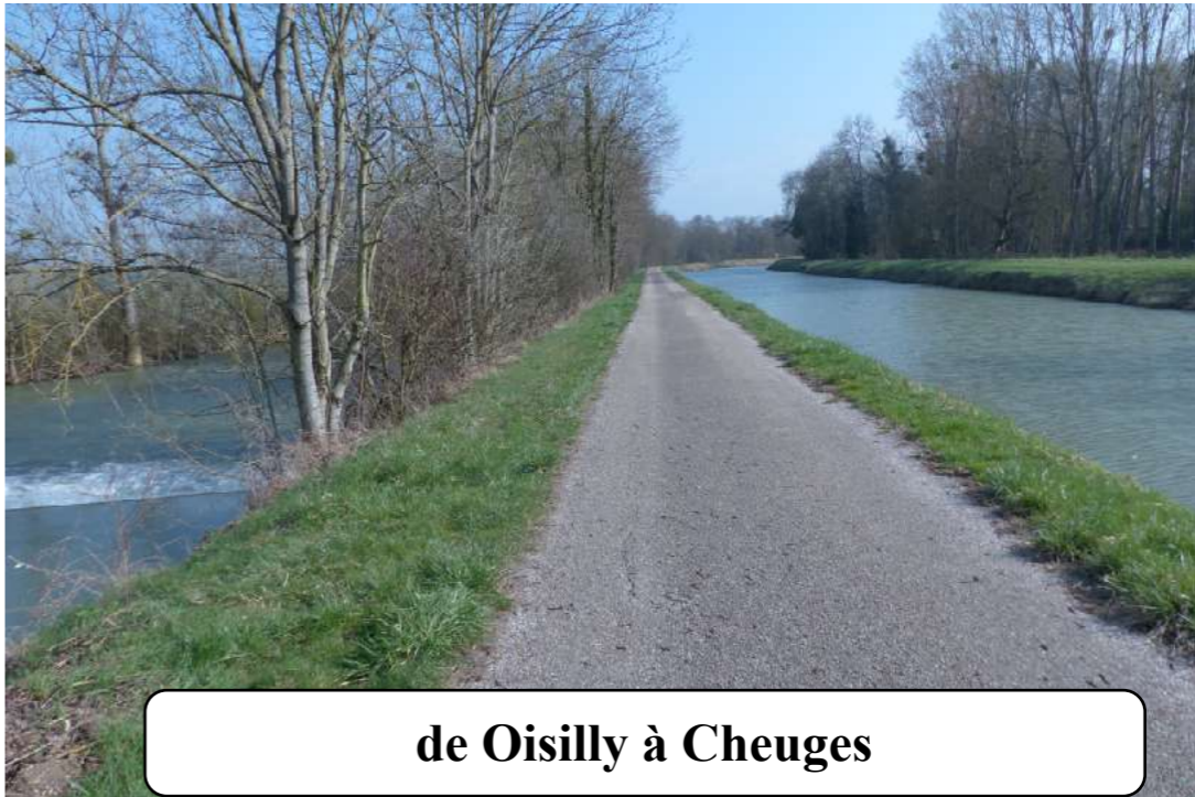
de Oisilly à Cheuges