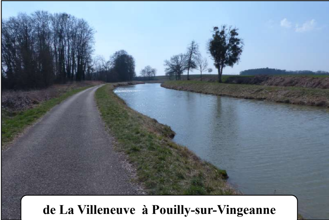
de La Villeneuve à Pouilly-sur-Vingeanne