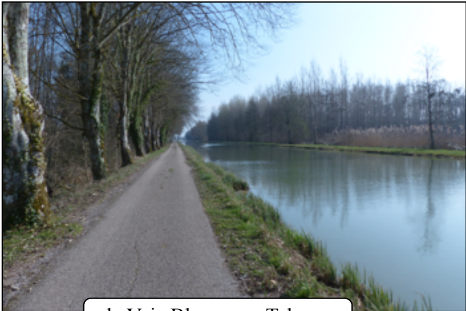
la Voie Bleue vers Talmay

de Heuilley (70) Courchamp (21) à Maxilly-sur-Saône (21) le long du canal « entre Champagne et Bourgogne » 39 km