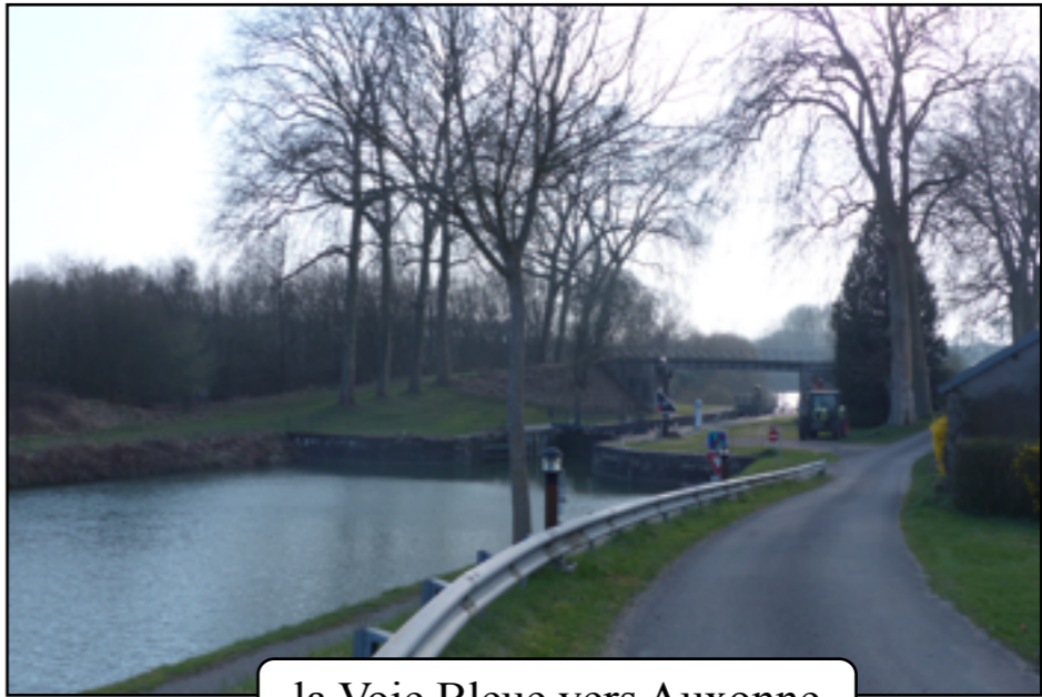
la Voie Bleue vers Auxonne