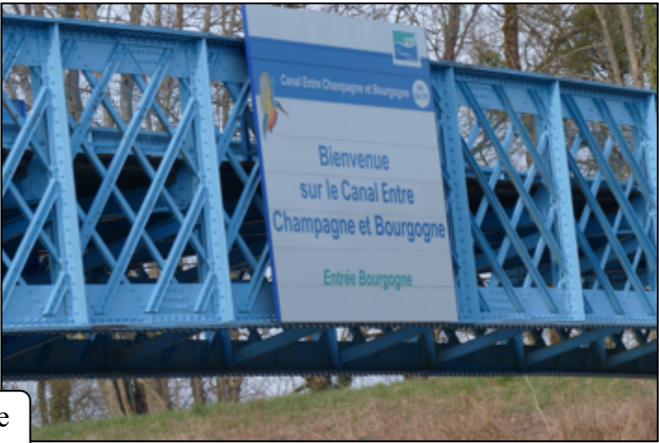
c'est ici que se termine le canal entre Champagne et Bourgogne, en rejoignant la Saône