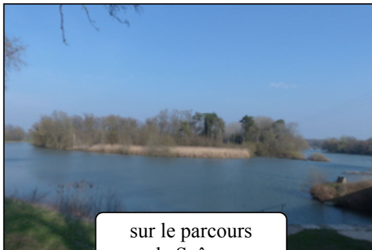
sur le parcours la Saône