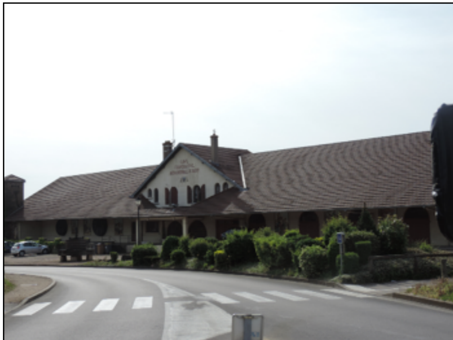
l'importante Cave Coopérative Intercommunale de Buxy