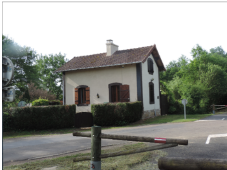
toujours des souvenirs de l'ancienne voie ferrée