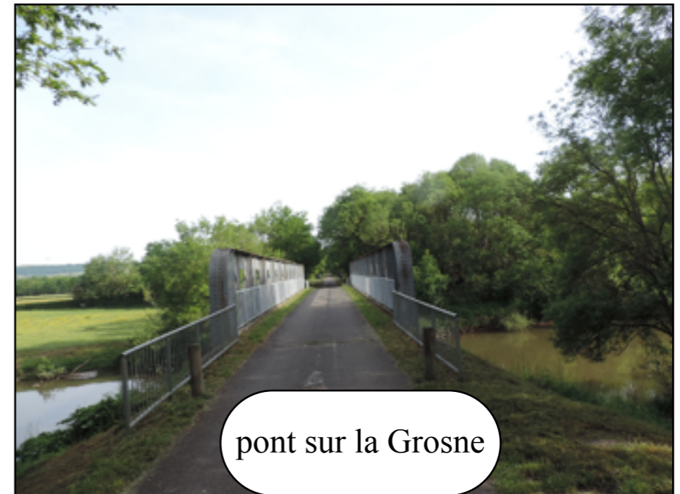
pont sur la Grosne