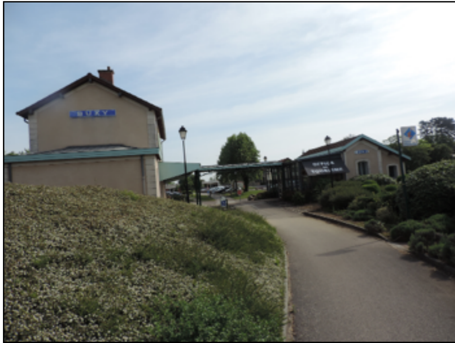
l'ancienne gare de Buxy