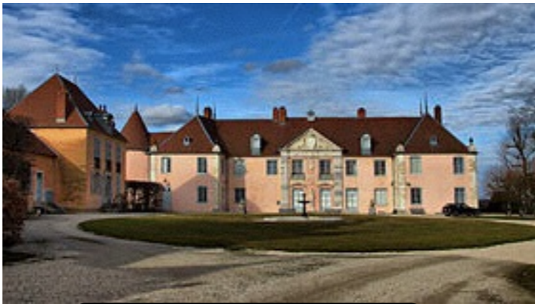
le château de Torpes