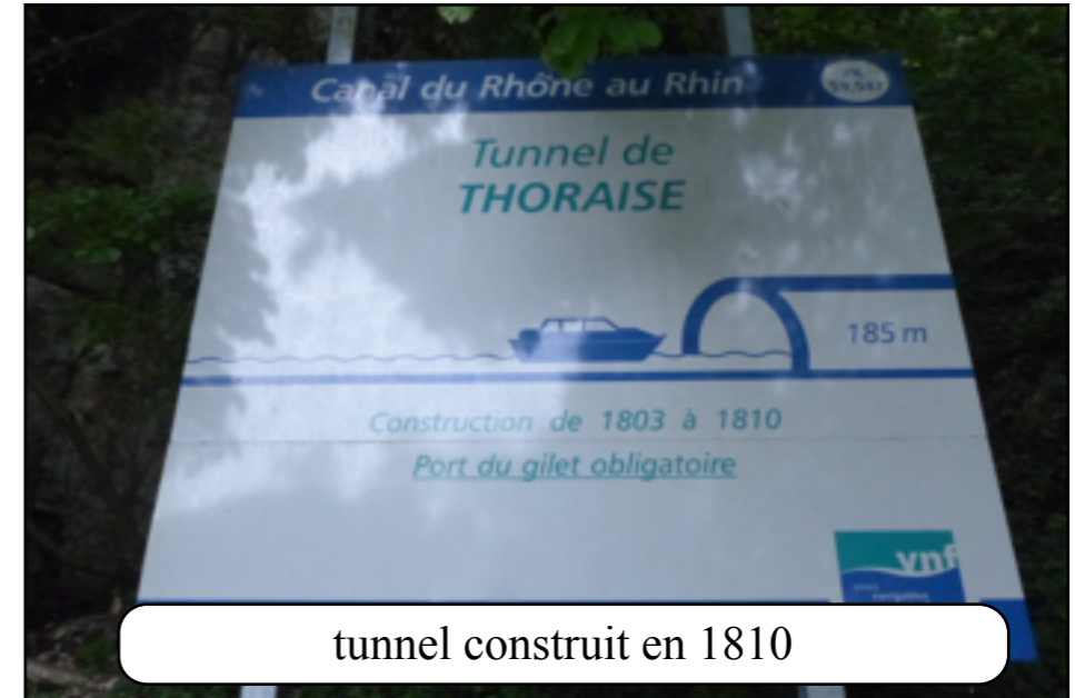
tunnel construit en 1810