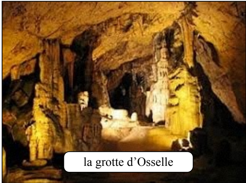
la grotte d'Osselle

En savoir plus (Accès à un livret avec carte, photos et textes)