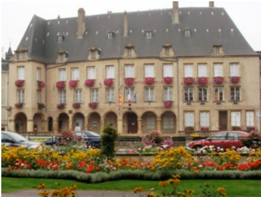
l'Hôtel de Ville, ancien couvent des Clarisses, construit au 17ème siècle

à droite, la Tour aux Pucés, (certainement le donjon d'un château-fort) a été construite vers 1100 mais largement restaurée au 16ème siècle, sous l'occupation espagnole.