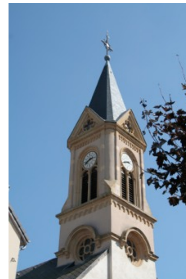
ancienne église paroissiale Saint-Michel

L'ancienne église Saint-Michel, datant du XVIIIème siècle étant jugée trop petite, une nouvelle église est construite. Terminée en 1940, elle ne sera consacrée qu'en 1946. L'ancienne église est alors désaffectée.