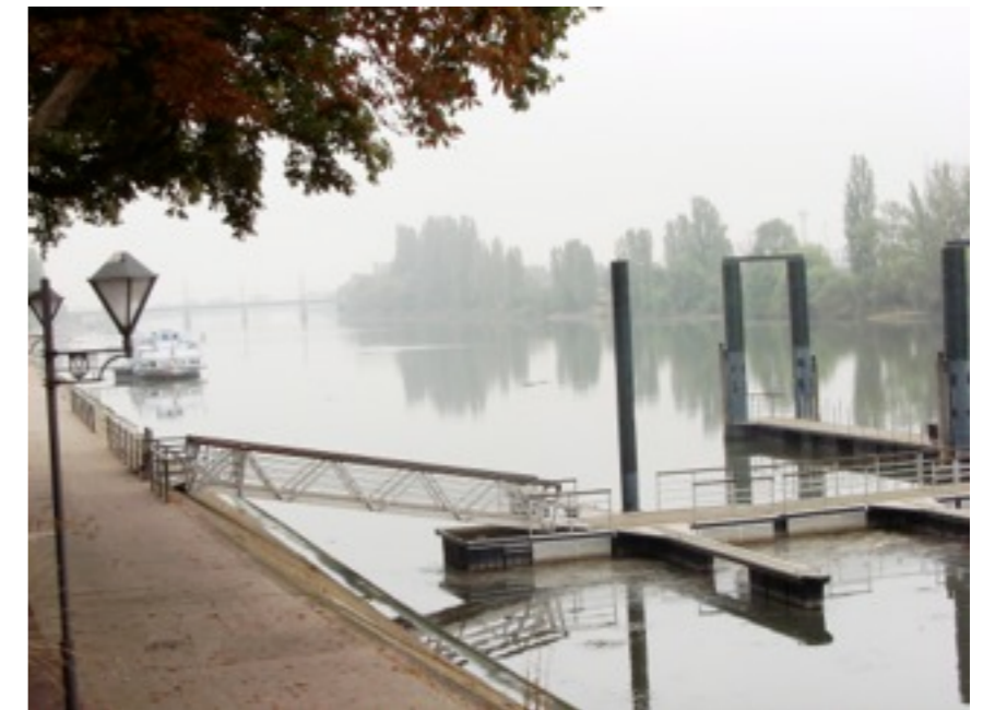
la Moselle depuis le pont des Alliés

à gauche, l'église Saint-Maximin, initialement consacrée en 1759 et largement restaurée après la guerre de 1870