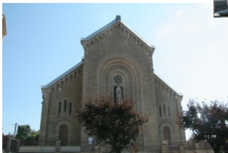
nouvelle église paroissiale Saint-Michel

L'ancienne église Saint-Michel, datant du XVIIIème siècle étant jugée trop petite, une nouvelle église est construite. Terminée en 1940, elle ne sera consacrée qu'en 1946. L'ancienne église est alors désaffectée.