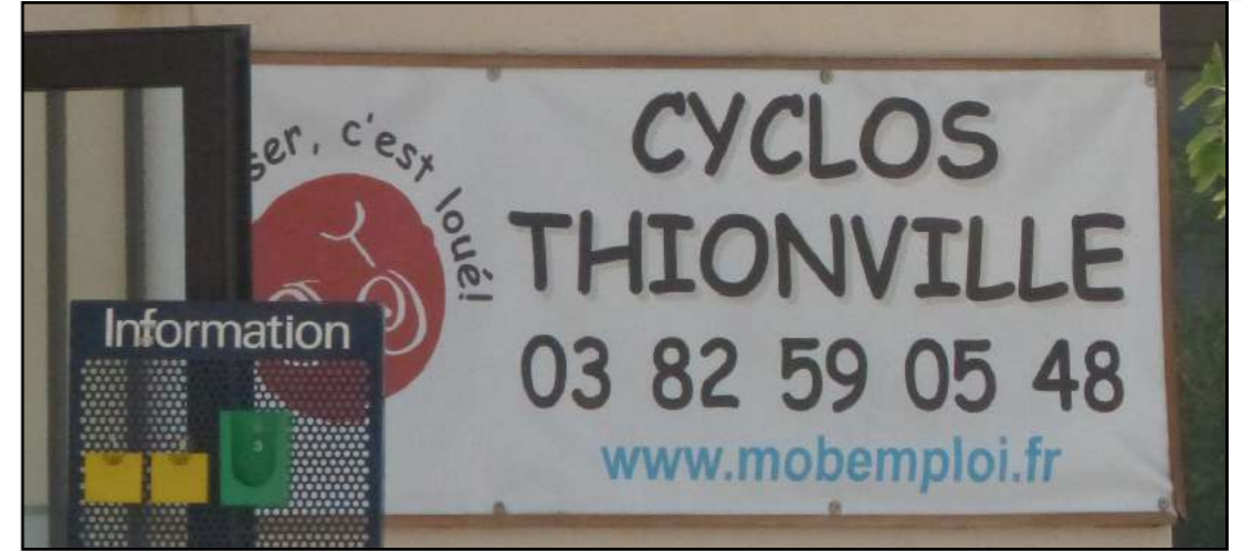
En savoir plus [Accès à un livret avec carte, photos et textes]