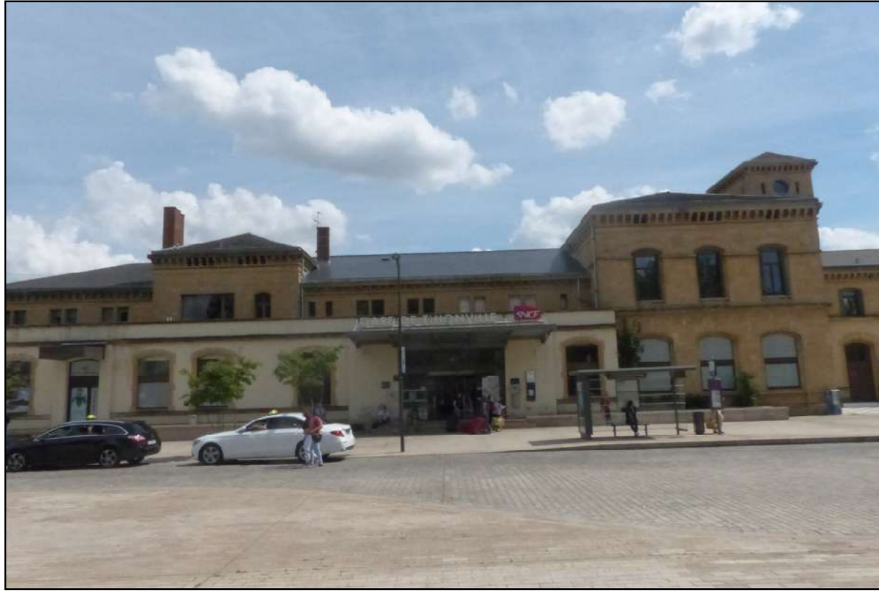
En savoir plus [Accès à un livret avec carte, photos et textes]