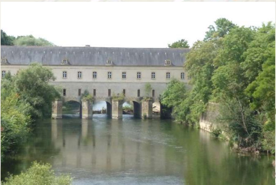
Pont-Ecluse de Cormontaigne

En savoir plus (Accès à un livret avec carte, photos et textes)