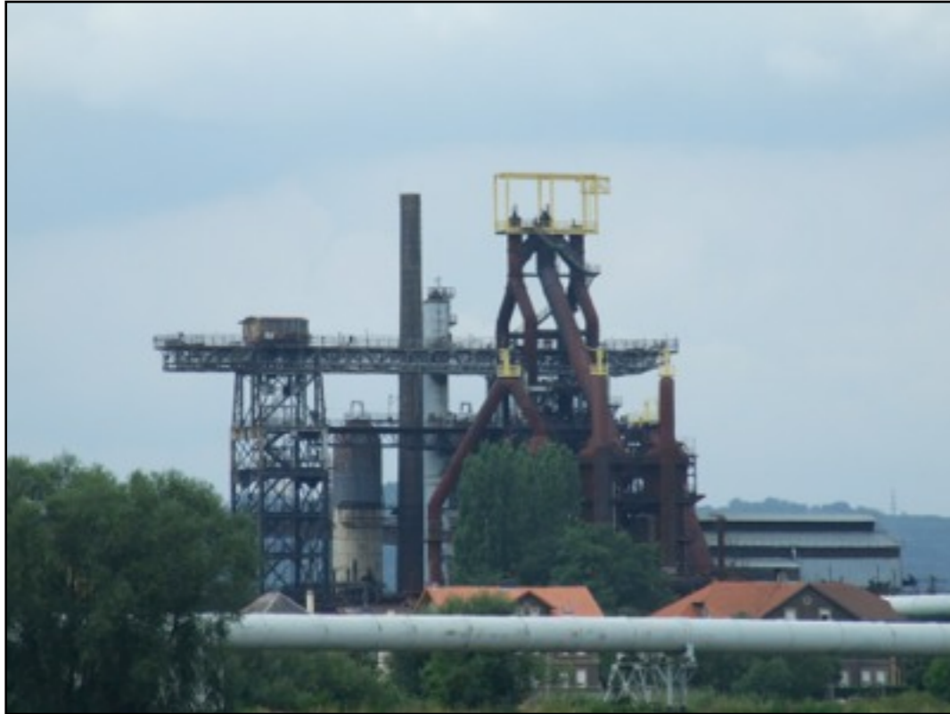
Le Haut-Fourneau de Uckange. Arrêté en 1991, le U4 est devenu monument historique