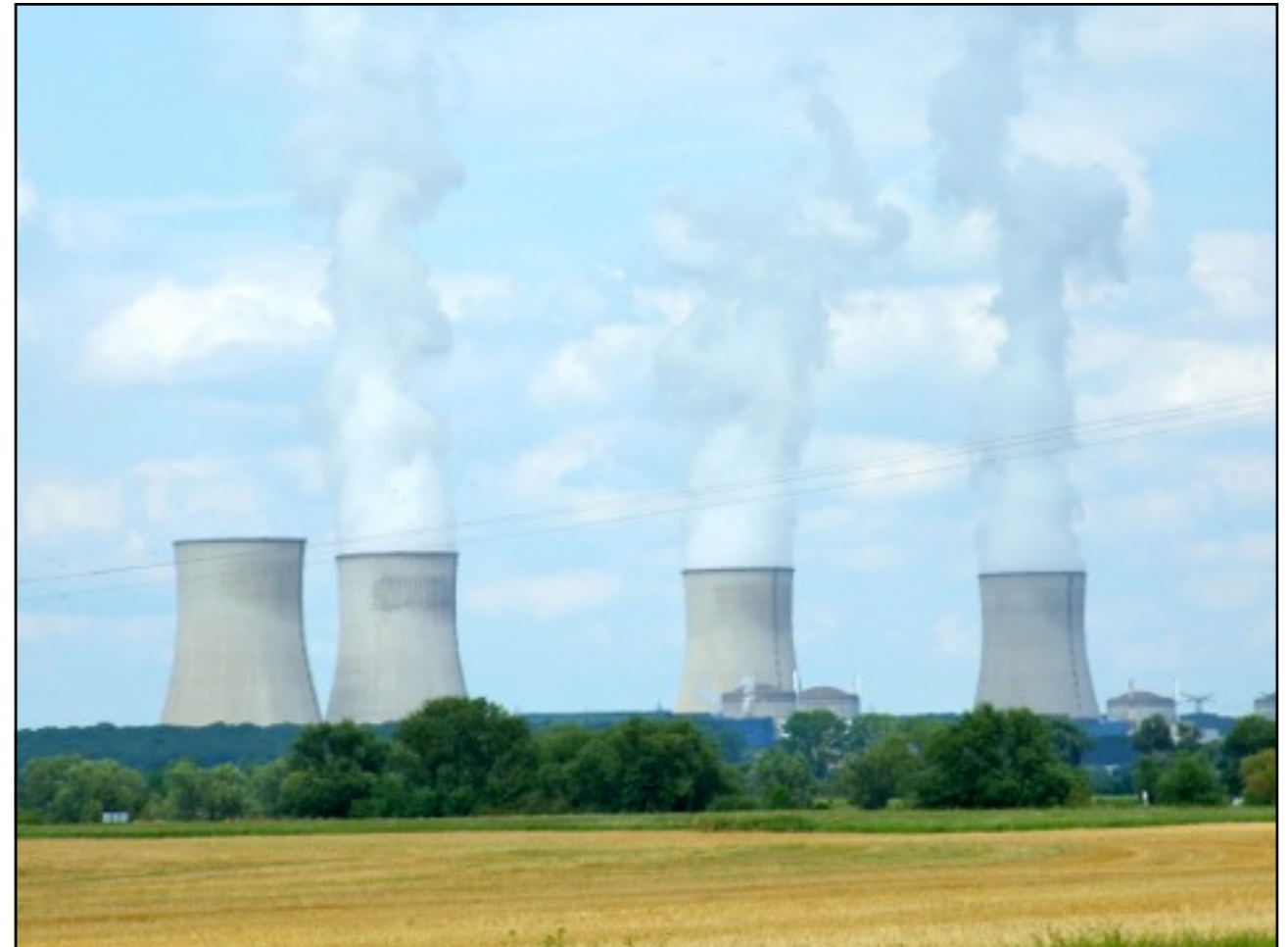
La Centrale nucléaire EDF de Cattenom