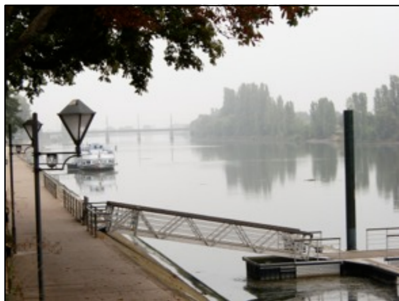
La Moselle à Thionville