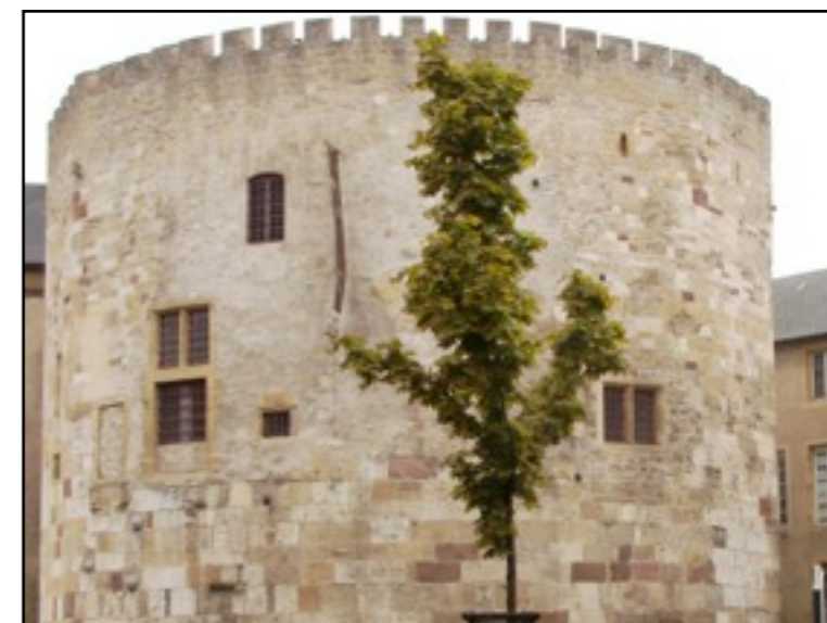
La tour aux puces