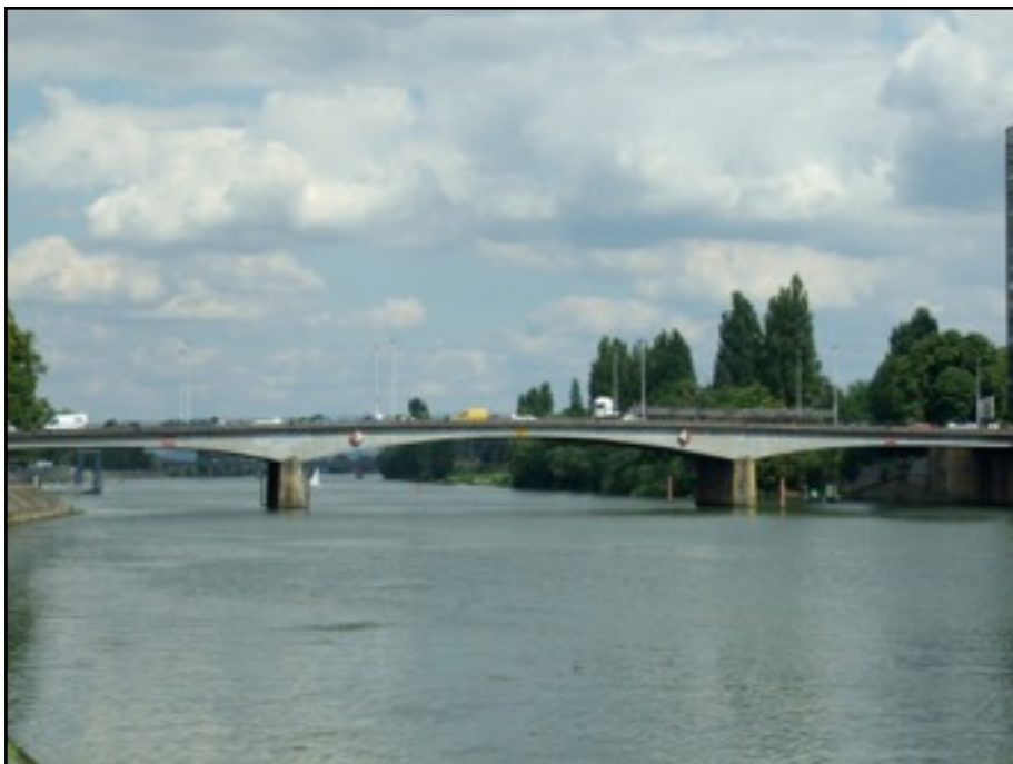
Thionville pont des alliés