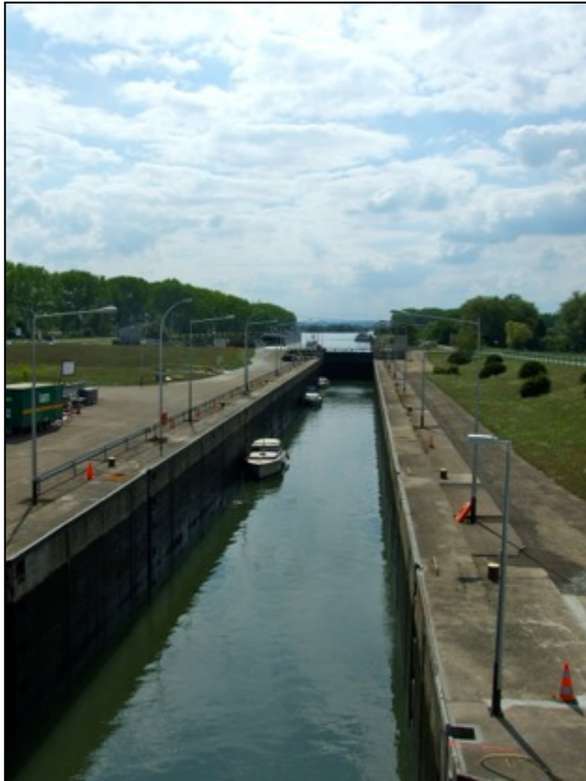
L'écluse de Koenigsmacker