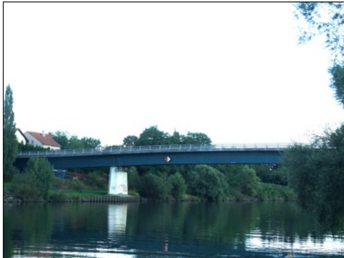
le pont de Malling, reconstruit en 1990