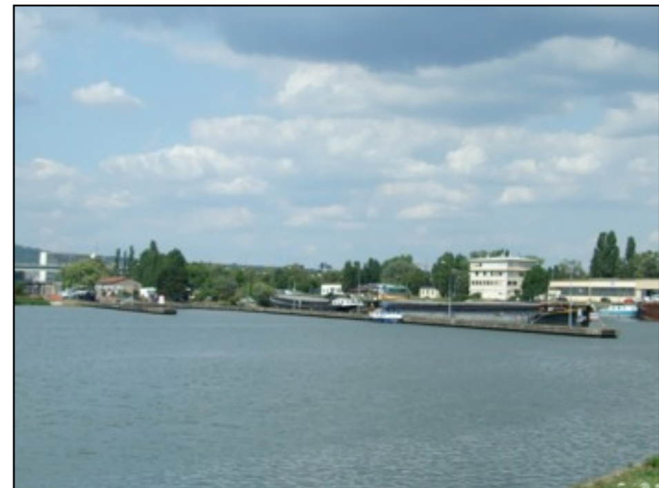
Thionville Ecluse Robert Schuman