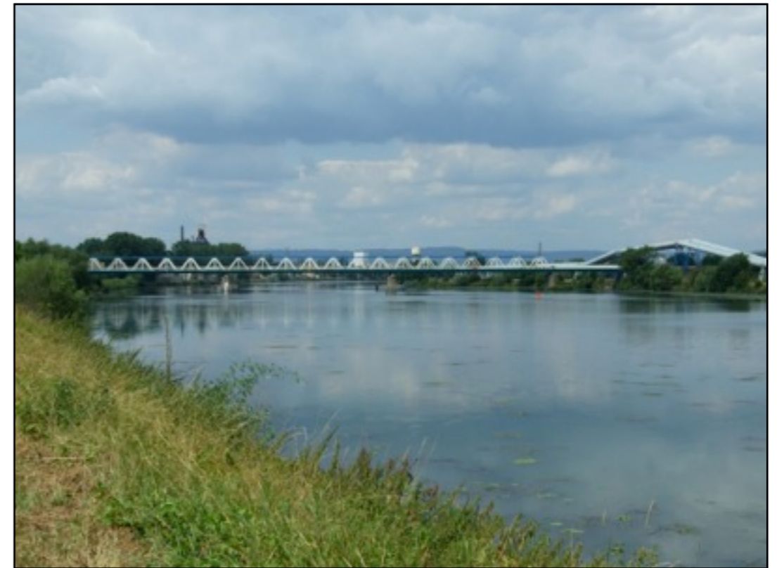
Reliant Uckange à Guénange, il a été construit en 1947, selon des plans réalisés par les Allemands. En Novembre 1944, les américains ont franchi la Moselle à cet endroit (opération Casanova)