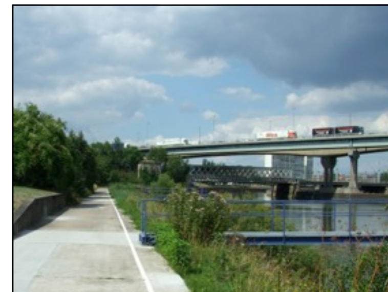
Le pont de l'A31