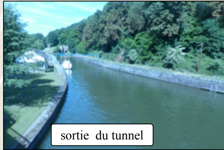
sortie du tunnel

(Accès à un livret avec carte, photos et textes)