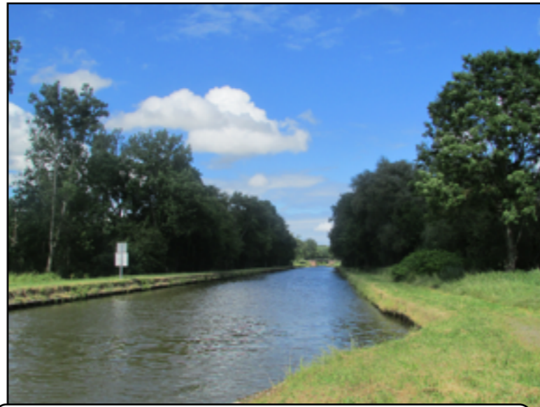
le canal se dirige vers le tunnel reliant Niderviller à Arzviller