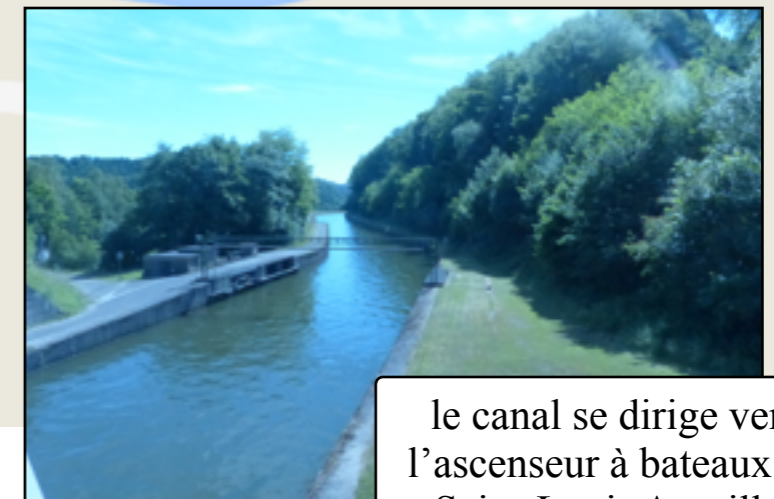
le canal se dirige vers l'ascenseur à bateaux de Saint-Louis Arzviller