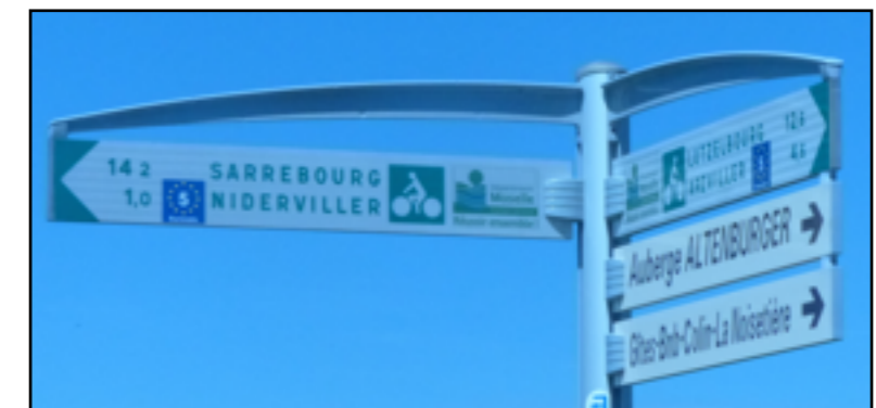
panneaux situés au croisement des rues du Vieux-Moulin et de Arzviller