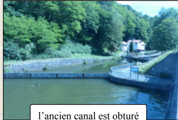
l'ancien canal est obturé