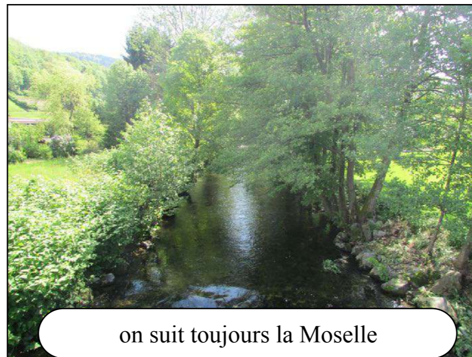
on suit toujours la Moselle