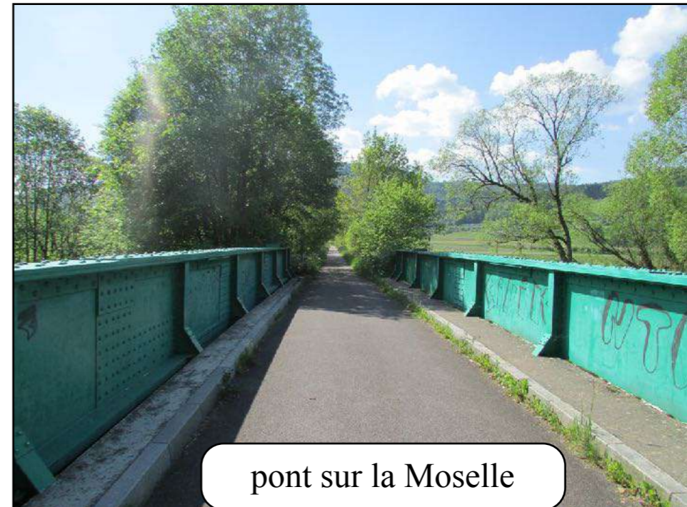
pont sur la Moselle