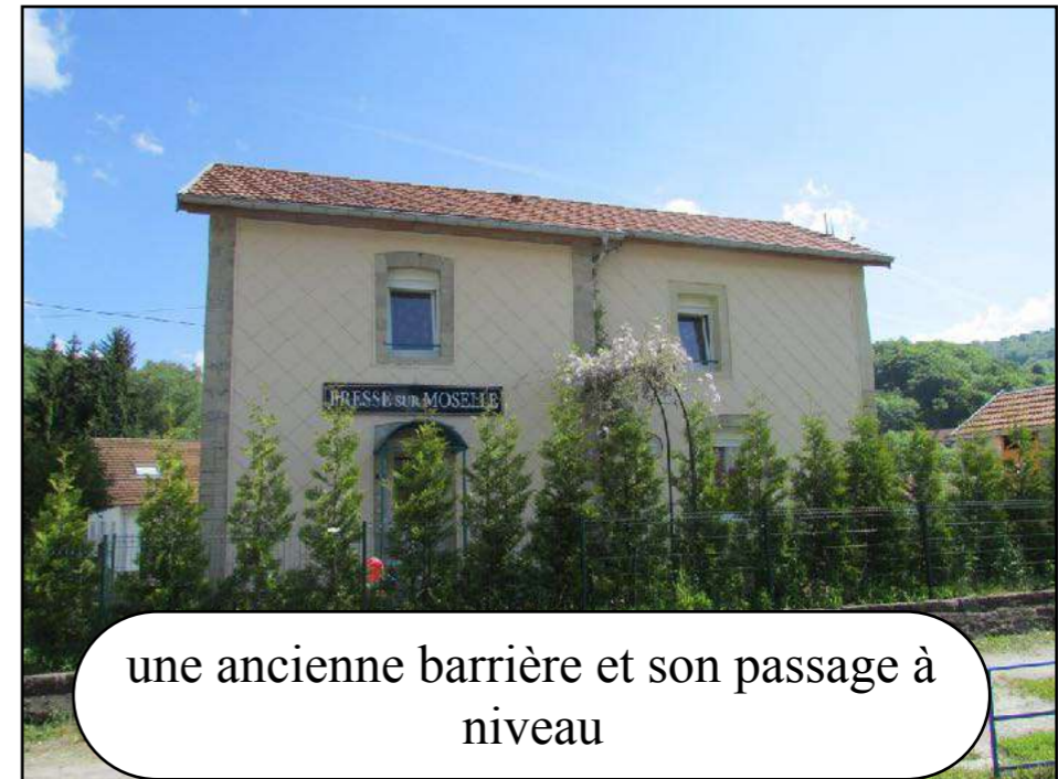
une ancienne barrière et son passage à niveau