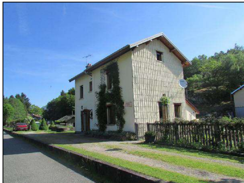
ancien passage à niveau avec sa barrière