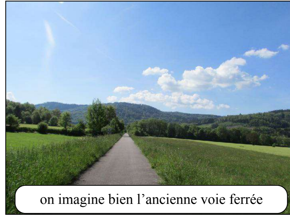
on imagine bien l'ancienne voie ferrée