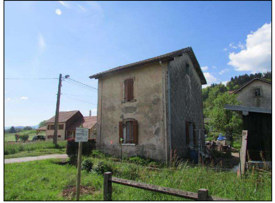
une ancienne barrière