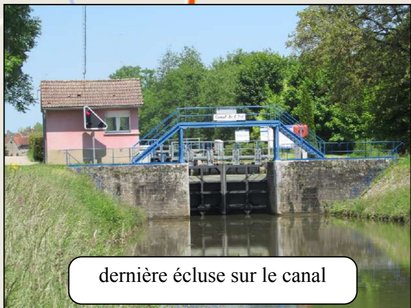
dernière écluse sur le canal

le canal de l'est (ou des Vosges) rejoint la Saône à Corre