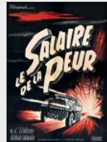
Le Salaire de la Peur 1953