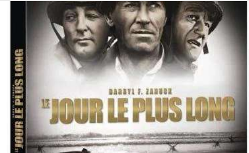
Le jour le plus long 1962