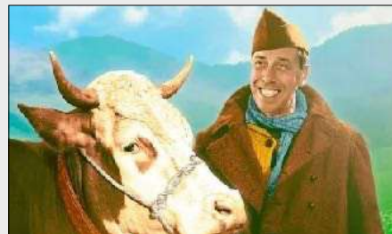
La vache et le prisonnier 1959