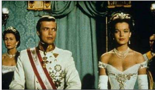
Sissi Impératrice 1956