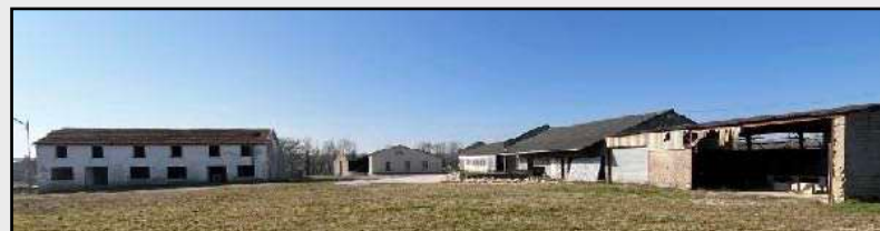
L'usine Kennel aujourd'hui