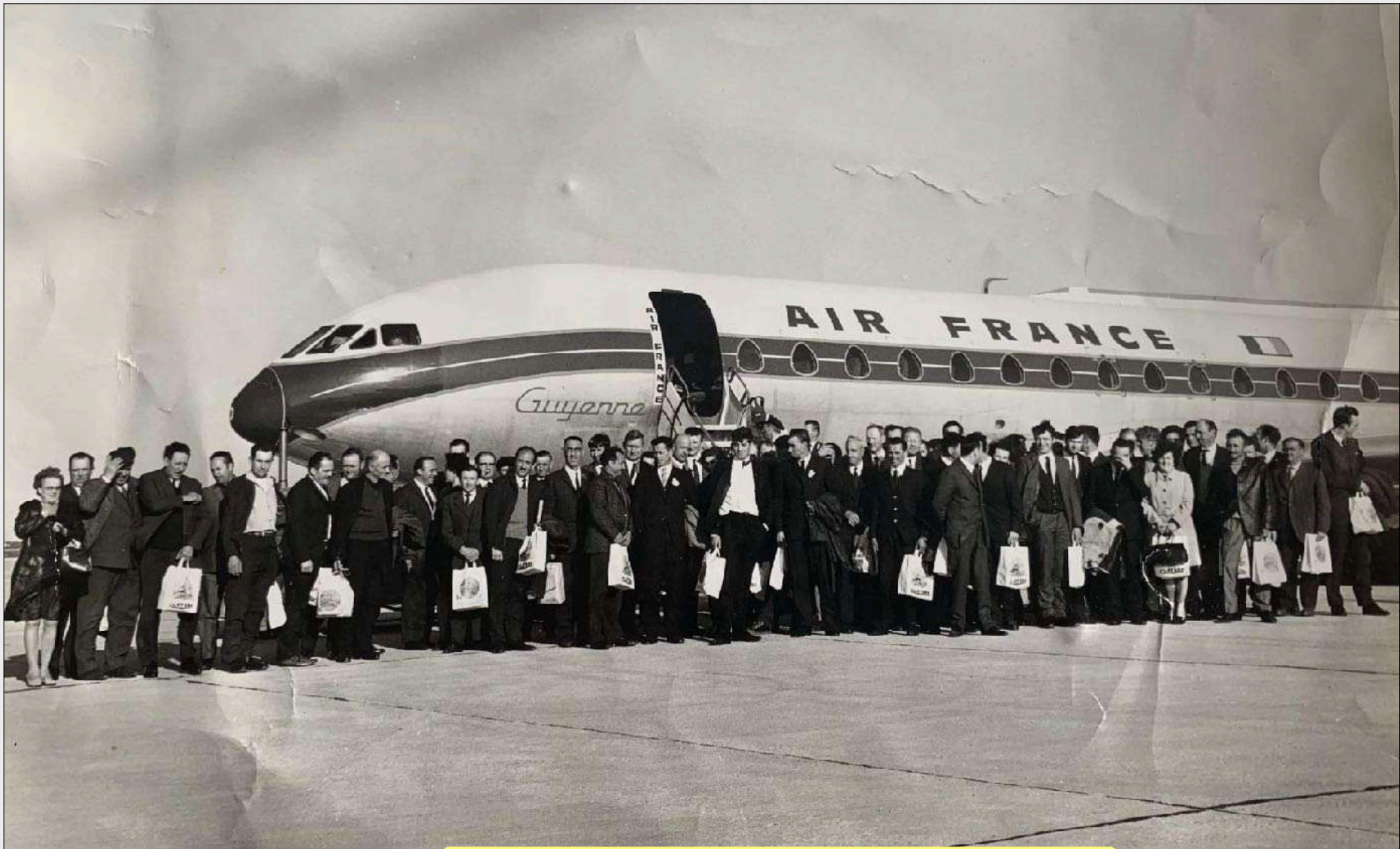
Visite de l'usine New-Holland à Basildon en Grande Bretagne au début des années 60.