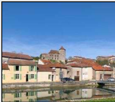
Vue depuis la rue du petit pont