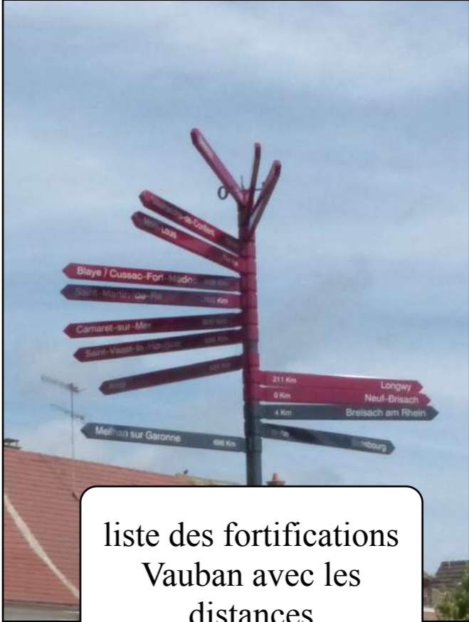
liste des fortifications Vauban avec les distances

En savoir plus (Accès à un livret avec carte, photos et textes)