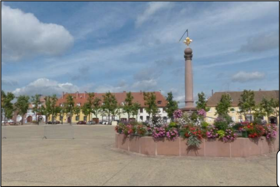
le Champ de Mars