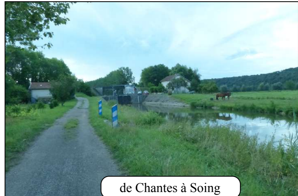
de Chantes à Soing