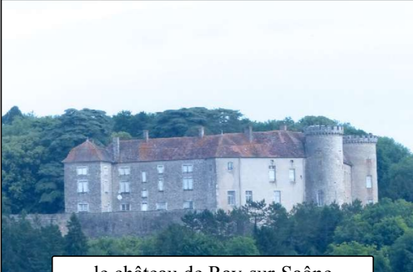
le château de Ray-sur-Saône