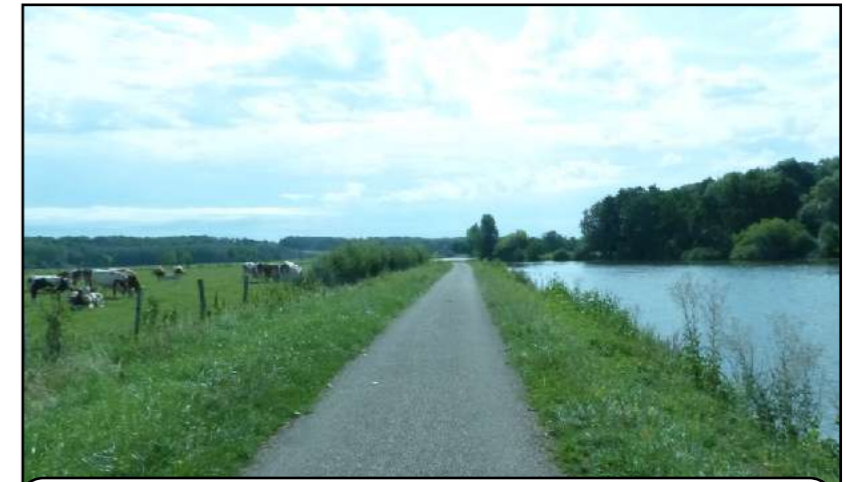
du tunnel de Saint-Albin à Rupt-sur-Saône