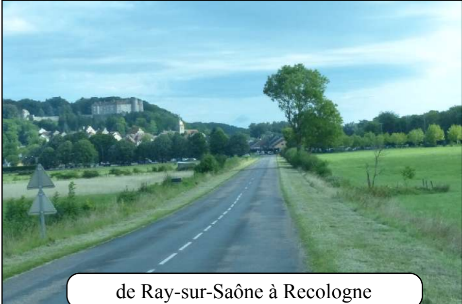
de Ray-sur-Saône à Recologne