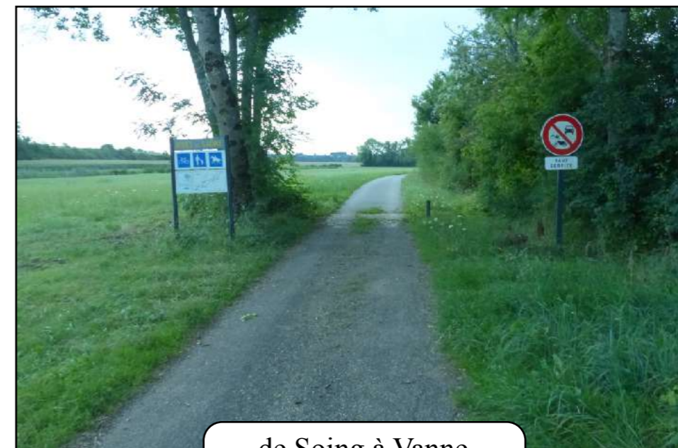
de Soing à Vanne