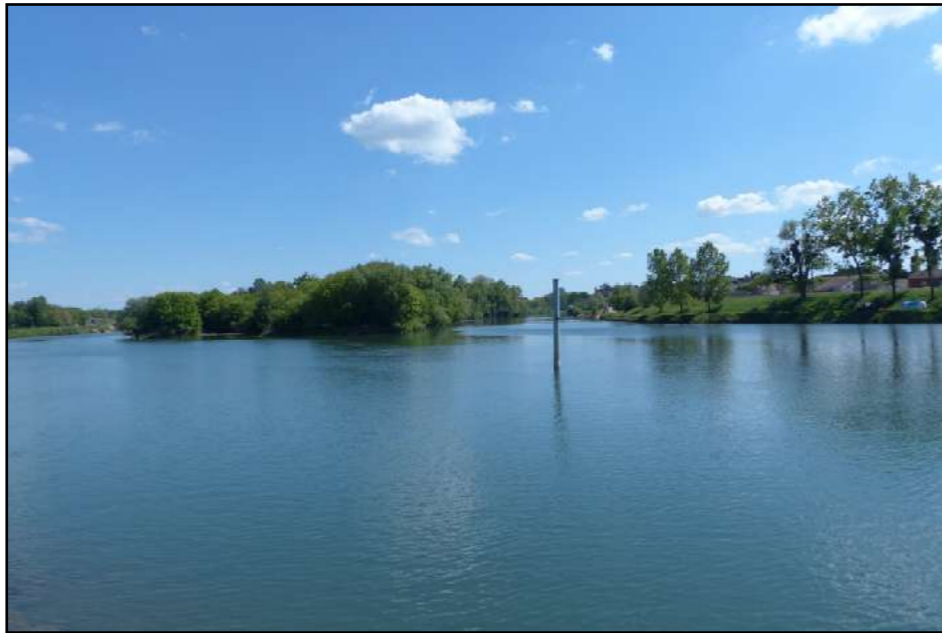
le confluent du Doubs et de la Saône