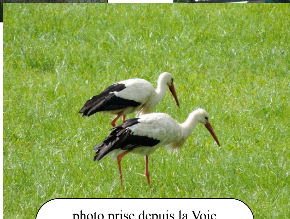
photo prise depuis la Voie Verte, quelques kilomètres plus tôt