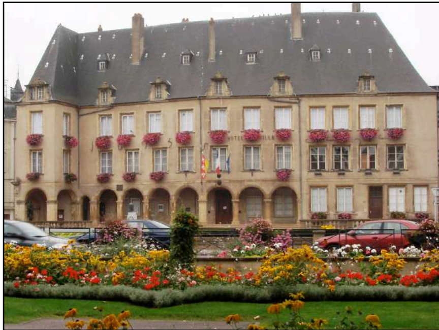
l'Hôtel de Ville, ancien couvent des Clarisses, construit au 17ème siècle

de Thionville à Havange par le Saint-Michel 17,5 km