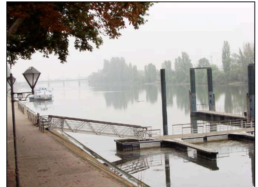
la Moselle depuis le pont des Alliés

à gauche, l'église Saint-Maximin, initialement consacrée en 1759 et largement restaurée après la guerre de 1870