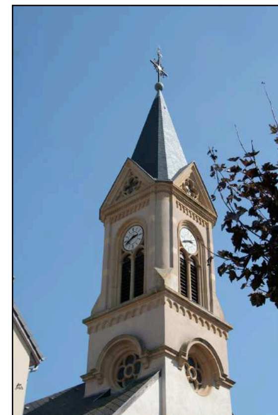
nouvelle église paroissiale Saint-Michel